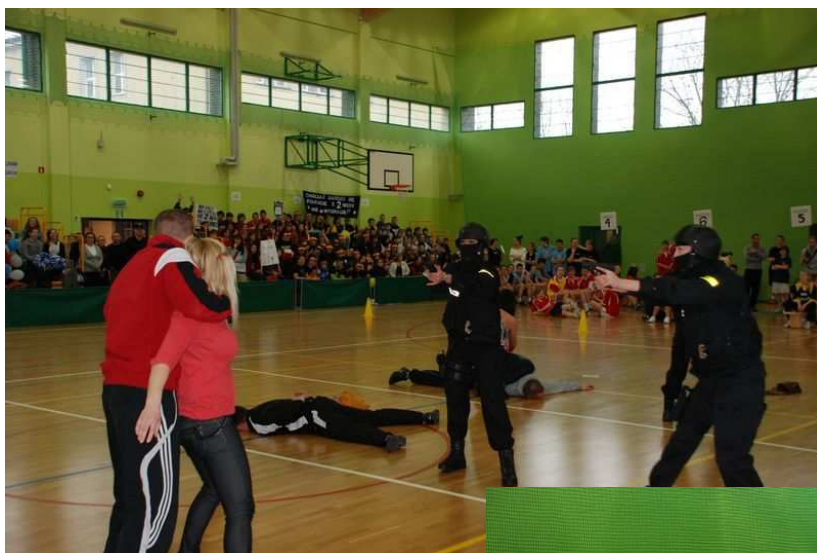
Rozgrywki podsumowujące program „Prewencja, ale inaczej”

Podsumowaniem zajęć przeprowadzonych w pierwszych klasach szkół gimnazjalnych Słupska były rozgrywki międzyszkolne, które odbyły się w dniu 13.04.2012 r. w hali sportowej Gimnazjum nr 4 w Słupsku. W rozgrywkach wzięły udział drużyny złożone z przedstawicieli klas I wszystkich gimnazjów biorących udział w programie. Uczniowie uczestniczyli w turnieju wiedzy oraz w rozgrywkach sportowych. Oprócz tego, po raz pierwszy w historii programu, do harmonogramu rozgrywek wprowadzony został turniej strzelecki. Uczestnikom rozgrywek kibicowali uczniowie z poszczególnych szkół, a najgłośniej i najbardziej ciekawie dopingująca drużyna została nagrodzona przez organizatorów. Turniej zakończył się zwycięstwem uczniów Gimnazjum nr 5. W programie wzięło udział ponad 850 uczniów.