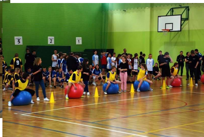
Rozgrywki podsumowujące program „Prewencja, ale inaczej”